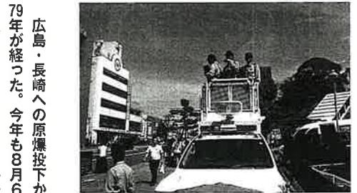
雑踏事故等の防止のための広報【長崎】

広島・長崎への原爆投下から79年経った。今年も8月6日に広島市で、8月9日に長崎市にて、被爆者や遺族、首相や各国大使らが参加する原爆慰霊祭が行われた。なお、昨年台風に見舞われた長崎は2年ぶりの屋外開催となった。