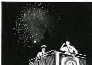
【神宮】広報車からの警備広報