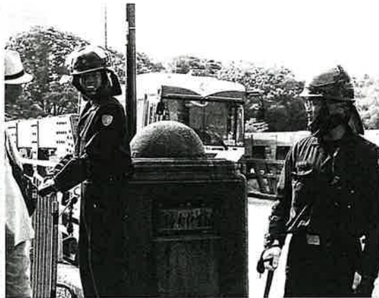
通行人に挨拶する機動隊員【広島】