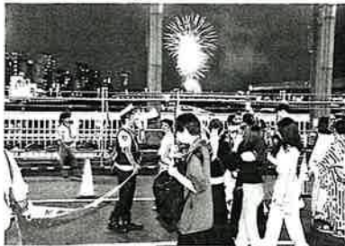
【隅田川】歩行者への積極的な呼びかけ

隅田川に浮かぶ2隻の台船から、1時間半かけて約2万発の花火が打ち上げられた。隅田川を挟む台東、墨田両区の2会場には、家族連れや外国人観光客ら約91万人(主催者発表)の見物客が訪れた。時折、小雨が降るなか色彩豊かな花火が打ち上げられ、会場には大きな拍手と歓声が上がった。