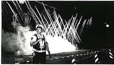
【葛飾】河川敷での警備広報

昨年77万人が来場した同大会。今年も同様の観客数が見込まれたものの、開催3日前に隣接する足立区の花火大会が雨や雷の影響により直前で中止となる出来事があった。当日も大気が不安定となる予報があったが、天候に恵まれ無事に開催された。夜空には約1万5千発の花火が打ち上げられ、人々を魅了した。