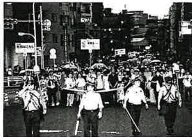
【隅田川】観客の滞留を防ぐための整理誘導