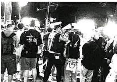
【神宮】混雑した沿道で安全な通行を呼びかけ

今年の来場者数は4万4千人。約1万発の花火が打ち上げられた。会場の神宮球場や秩父宮ラグビー場では多彩なアーティストのライブも実施。観客は演奏される音楽とともに花火を楽しんだ。会場は有料のチケット制であるものの、周辺の道路などはチケットなしで鑑賞する人たちが混雑が見られた。