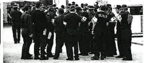
打合せにて警備状況の確認【広島】

8月6日午前8時から広島市の平和記念公園で行われた広島市原爆死没者慰霊式並びに平和祈念式は、被爆者や遺族の代表をはじめ、岸田総理大臣のほか、109か国の大使などを含むおよそ5万人が参列。被爆者や遺族らが犠牲者の冥福を祈った。昨年はデモの参加者が市の職員に集団で体当たりするため、広島市は今年、式典への入場を規制