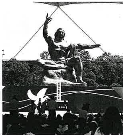
平和祈念像を前にした式典会場【長崎】